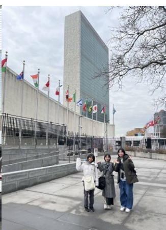
国連前で記念撮影