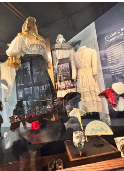
右の展示:かつて様々な国から移動してきた移民の宝物が保管されている。