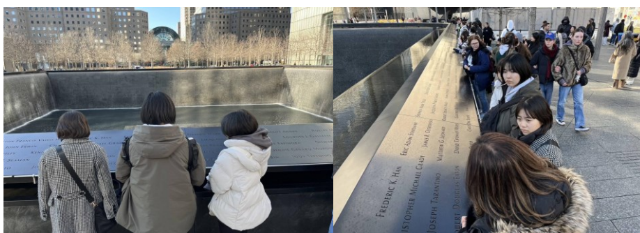
「プール」と呼ばれるワールドトレードセンター跡にて学習する様子

グラウンド・ゼロに赴き9.11メモリアルや慰霊碑を見学しました。ここは2001年9月11日にイスラム過激派テロ組織アルカイダによるテロ攻撃を受けた場所です。攻撃を受けたワールドトレードセンター跡には、亡くなった方の鎮魂と慰霊のためプールと呼ばれるモニュメントがあり、周りには亡くなった犠牲者たちの名前が刻まれていました。9.11メモリアルには、旅客機がビルに突っ込む映像や、ビルが崩壊する映像、一部が溶けている消防車、犠牲者らの肉声や遺品、映像が展示されており、この事件で罪のない多くの民間人や消防士の方々が亡くなったという事実の重みを肌で感じました。亡くなった方だけでなく、遺族の方々の悲しみも忘れてはならないと思いました。