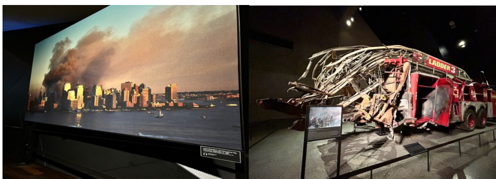
9.11メモリアルの展示の様子