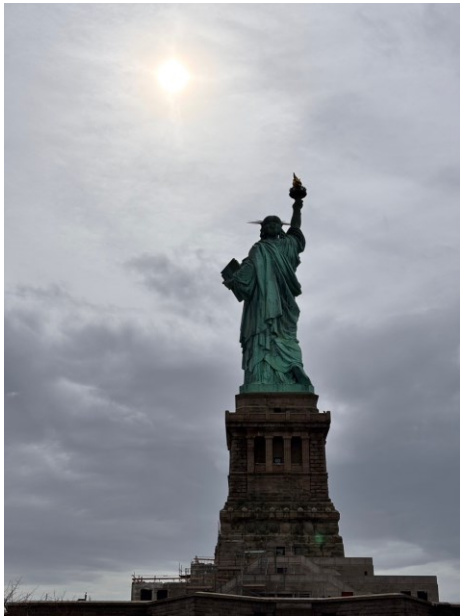
後ろから見た自由の女神

自由の女神像があるリバティー島と移民博物館があるエリス島へ行き、自由の女神や移民の歴史について学びました。エリス島は1892年から1954年の62年間連邦移民局が置かれ、1200万人を超える移民を受け入れた場所として知られています。船を使って、エリス島に移動したため、自分自身も移民としてエリス島に訪れたような疑似体験ができました。当時の移民入国審査の方法や流れ、様子がわかる展示(下の写真など)は、当時使われていたものも多く残っており、新しい土地で働く移民の期待や喜び、または不安や緊張、嘆きを感じられました。