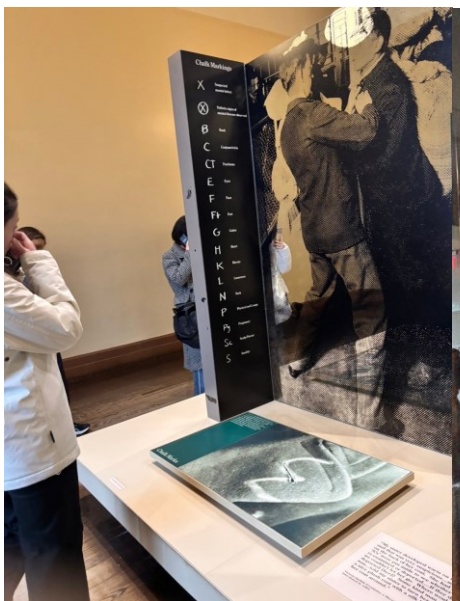
左の展示:異常があると見られる移民は首元にチョークで印をつけられた。