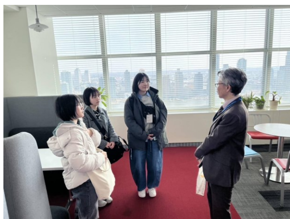
益子さんの話を聞く様子