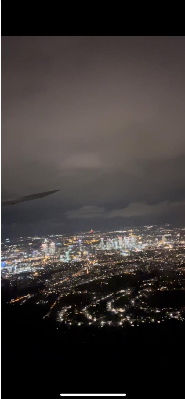
フランクフルト上空から撮影