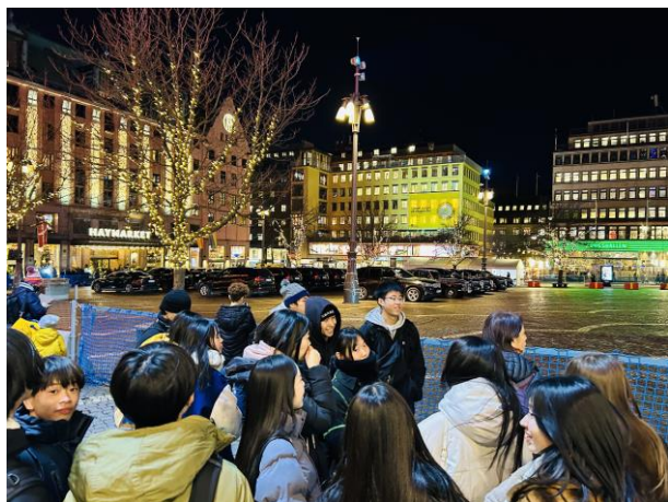
夜のストックホルム