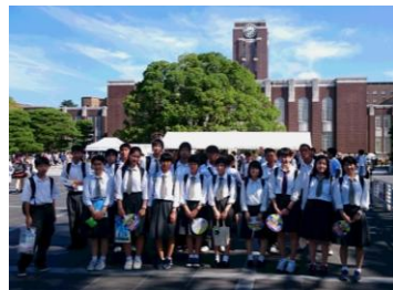
【京大OC先輩との座談会】