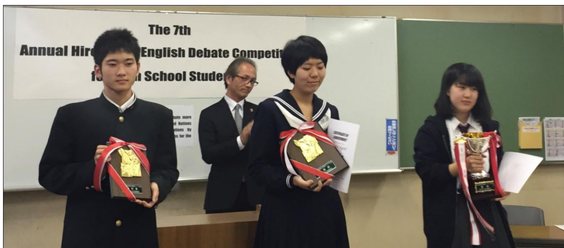
入賞…右から、第1位舟入高校、第2位尾道東高校、ベストディベーターです。