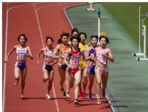
「このままでは遅い」400mから先頭へ