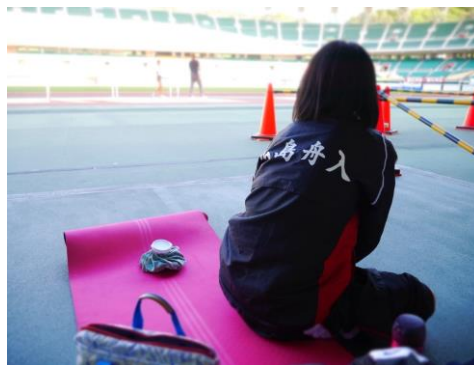
メイン競技場で社会人に混ざり調整練習