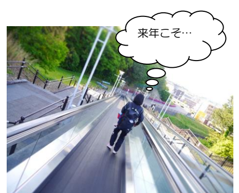
来年この大会は五輪の選考レースだ！

誰もが走れるわけではない大会に出場したということもあり、会場では小中学生にサインを求められて戸惑う場面も…今年度も、元気な一年生が加わり、50人でひとりひとりがより高みを目指して一丸となり、日々練習に励んでいます。