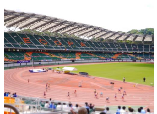
日本有数の大きな競技場エコパスタジアム