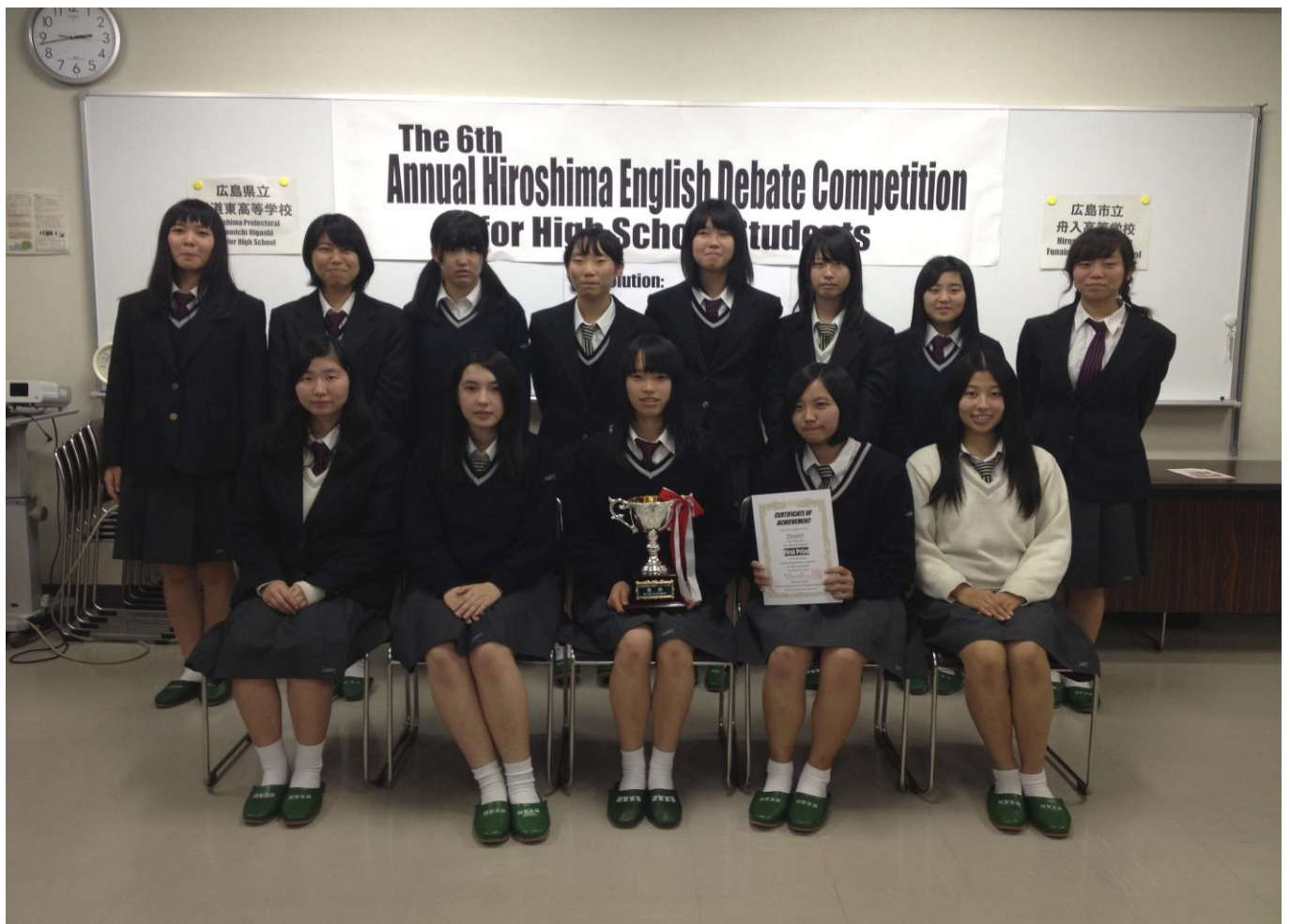
平成 26 年度 舟入高校 ESS 部 英語ディベートチーム