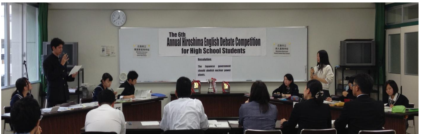
英語ディベート対戦のようす