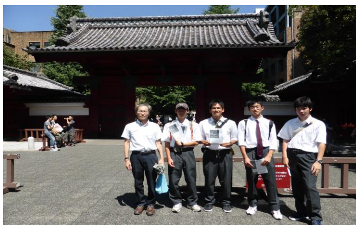
《赤門前で記念撮影》