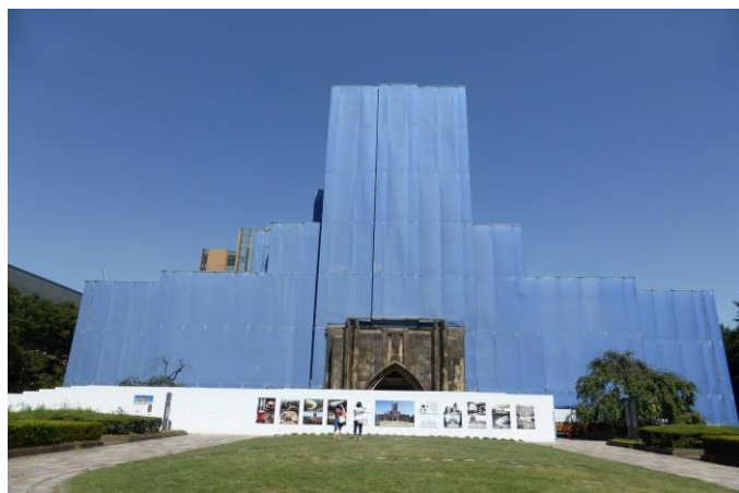
《安田講堂は工事中でした》