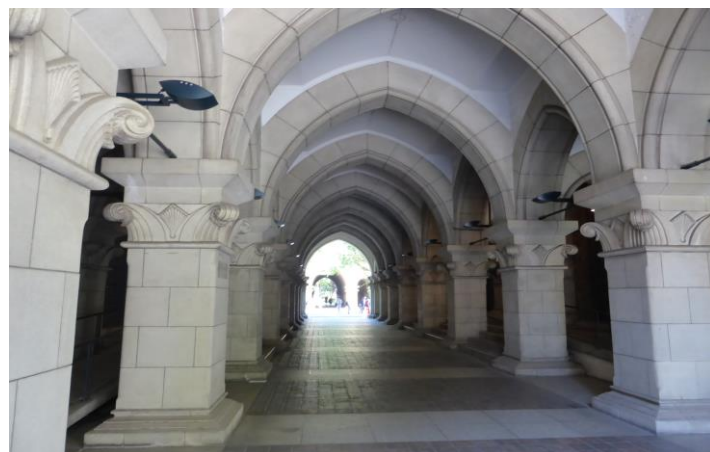
《伝統の重みを感じる建物です》