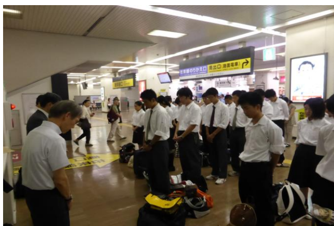
《コンコースで黙祷しました》