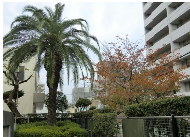
正門付近の桜とフェニックス