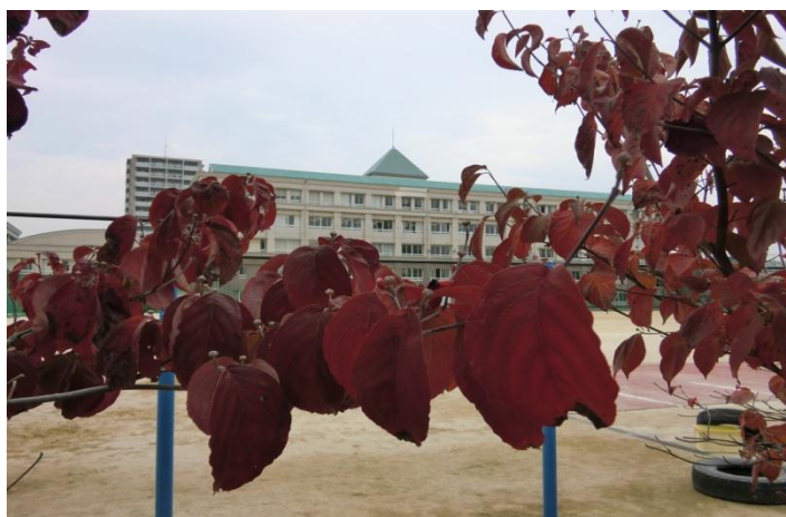
グラウンドのハナミスキ