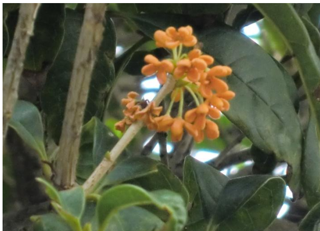
正門付近のキンモクセイ