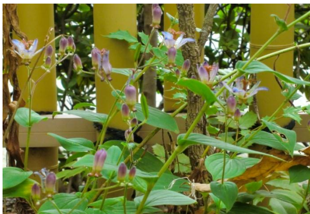
舟友館のホトトギス