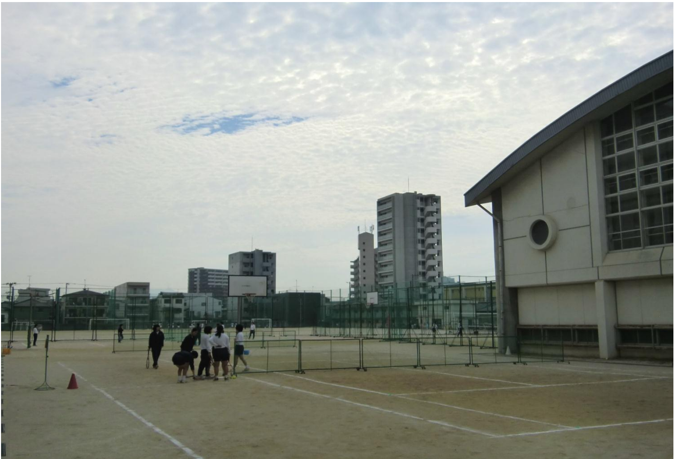
体育の授業（テニス）