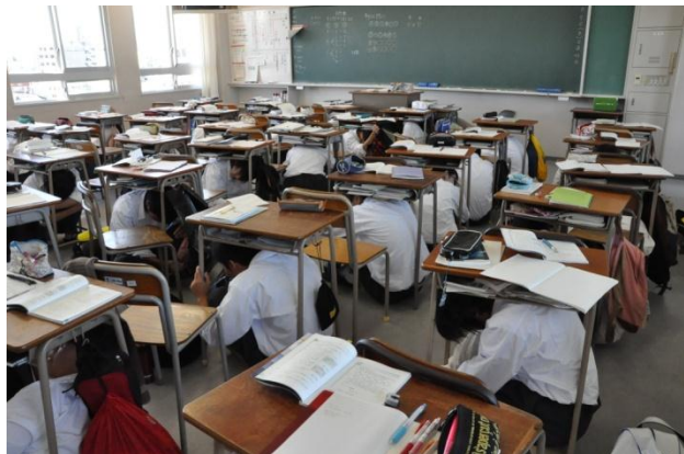
放送の指示で一斉に訓練しました。