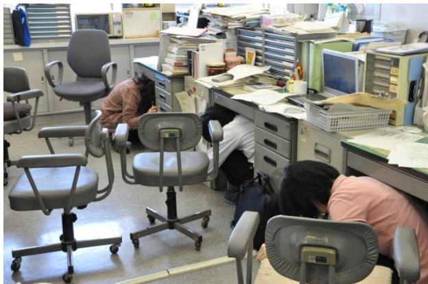
教科の研究室においても