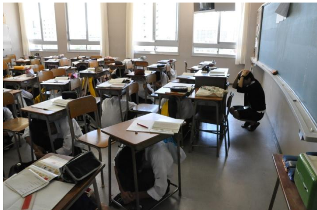
全員が真面目に訓練を行いました。