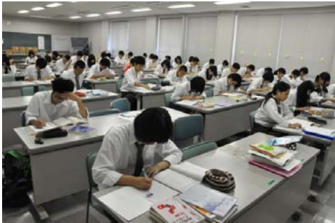
自習の様子1（会議室）