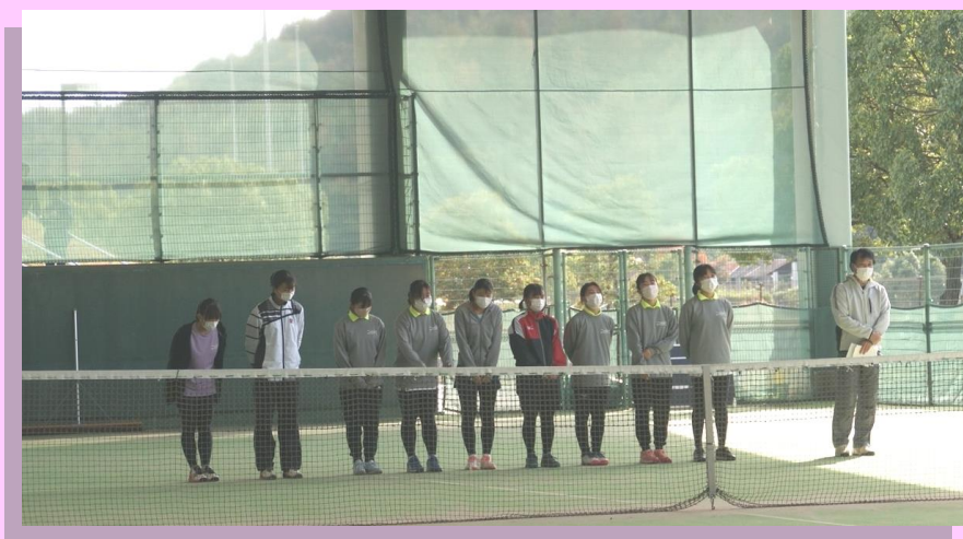
写真は団体戦の試合前のあいさつと試合の様子。