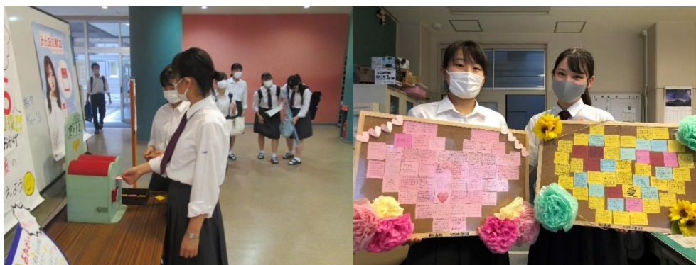
舟入高校総合展示ホールでメッセージ投函 8/3JRC部がメッセージをボードにまとめる