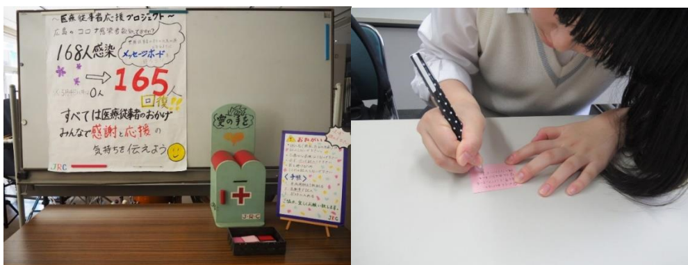
6/29～7/3ポスターとメッセージポストと色紙 ポスターで賛同した生徒がメッセージ記入

舟入高校JRC部では、新型コロナウイルス感染者への医療に最前線で取り組んでいただいている医療従事者の方々に対して、応援の気持ちと感謝の気持ちを舟入高校としてメッセージボードに載せて届けたいという取り組みを始めました。この取り組みは、JRC部の部員から発案され、JRC部→生徒会→職員会議と話し合いを繰り返し、実行されたプロジェクトでした。舟入高校の総合展示ホールに趣旨を書いたポスターを設置し、5cmマスの色紙に医療従事者の方々への応援や感謝の気持ちを書いてもらい、それをコルクボード60cmマスに貼って医療従事者の方々がそれを見て元気になれるようなものを届けたいと多くの生徒が協力してくれました。現在、そのメッセージボードは舟入市民病院で働いている方々に読んでいただける部屋に飾られています。