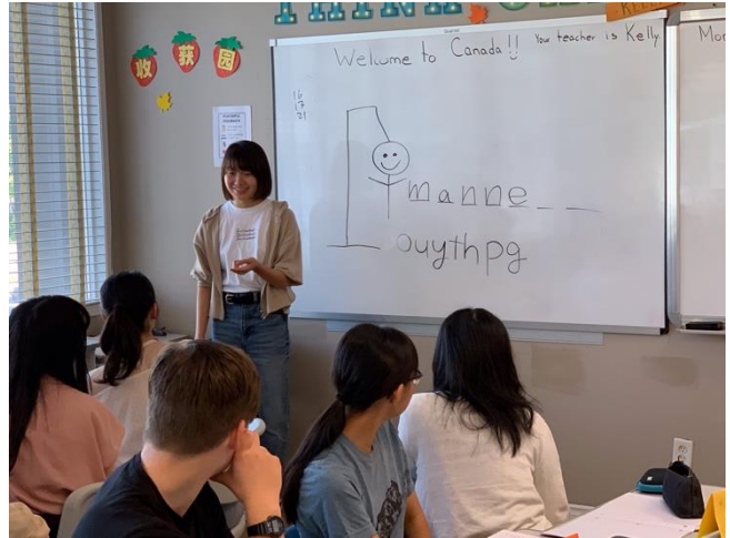
みんなで昼ごはんを食べた後は、お別れ会の出し物の練習。